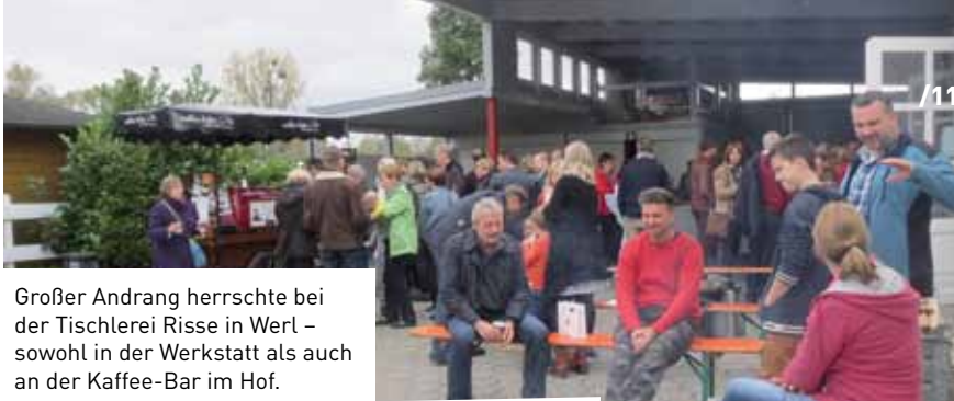
Großer Andrang herrschte bei der Tischlerei Risse in Werl – sowohl in der Werkstatt als auch an der Kaffee-Bar im Hof.