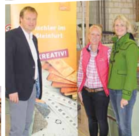
Die Bundestagsabgeordnete Anja Karliczek (rechts) war von ihrem Besuch bei Althaus Innenausbau in Ibbenbüren so begeistert, dass sie das Bild direkt bei Facebook postete.