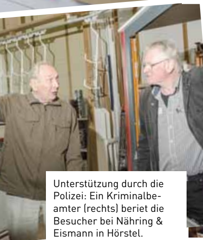
Unterstützung durch die Polizei: Ein Kriminalbeamter (rechts) beriet die Besucher bei Nährung & Eismann in Hörstel.