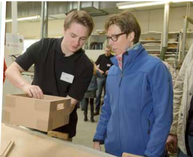
Bei der Tischlerei Dickmäken in Rheine konnten die Besucher viel Stauraum erleben und einen kleinen „Stauräumer“ selbst zusammenbauen.