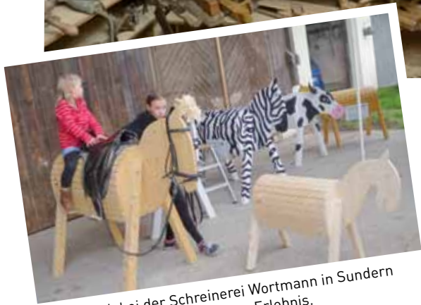
Der Besuch bei der Schreinerei Wortmann in Sundern wurde für einige zum tierischen Erlebnis.