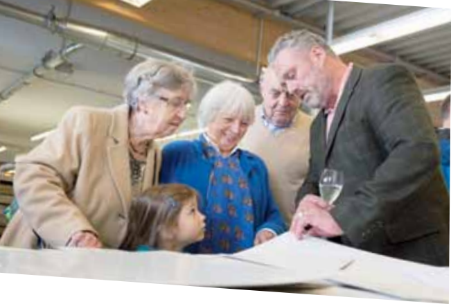
Live-Produktion: In der Schreinerei Krauß in Köln konnten die Kunden einen Blick auf die Fertigung ihrer neuen Küche werfen.