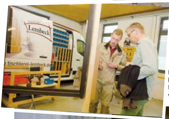
Einbruchschutz: Die Tischlerei Lembeck in Nordwalde hat eines ihrer Fahrzeuge rein für die Nachrüstung von Fenstern und Türen ausgestattet.