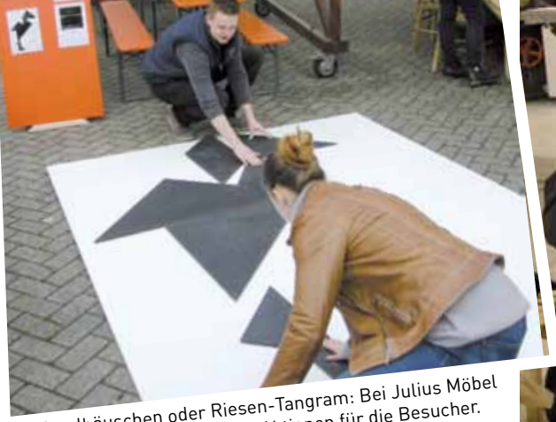
Ob Vogelhäuschen oder Riesen-Tangram: Bei Julius Möbel in Overath gab es jede Menge Aktionen für die Besucher.