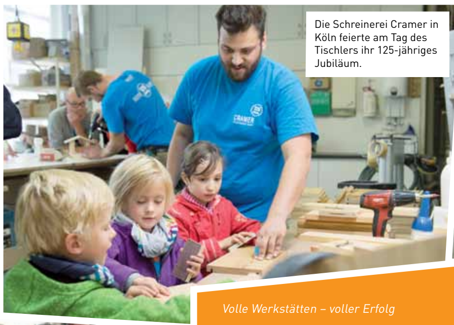
Die Schreinerei Cramer in Köln feierte am Tag des Tischlers ihr 125-jähriges Jubiläum.