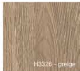
H3326 - greige

HOLZTUSCHE HOLZHANDEL • WWW.HOLZTUSCHE.DE • HOLZIMPORT