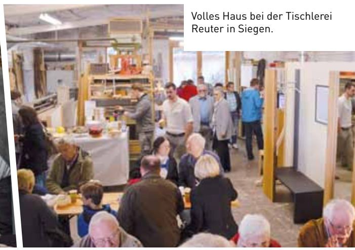
Volles Haus bei der Tischlerei Reuter in Siegen.