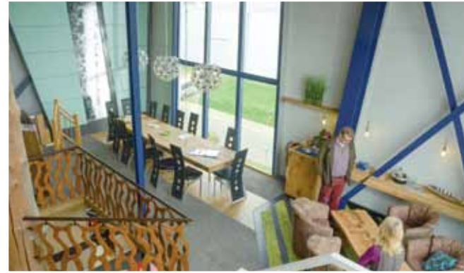
Rechts und oben: Kontrast bei Kessling – Die Tischlerei in Mettingen zeigt in ihrer Ausstellung eine uralte Werkstatt und moderne Einrichtungen.